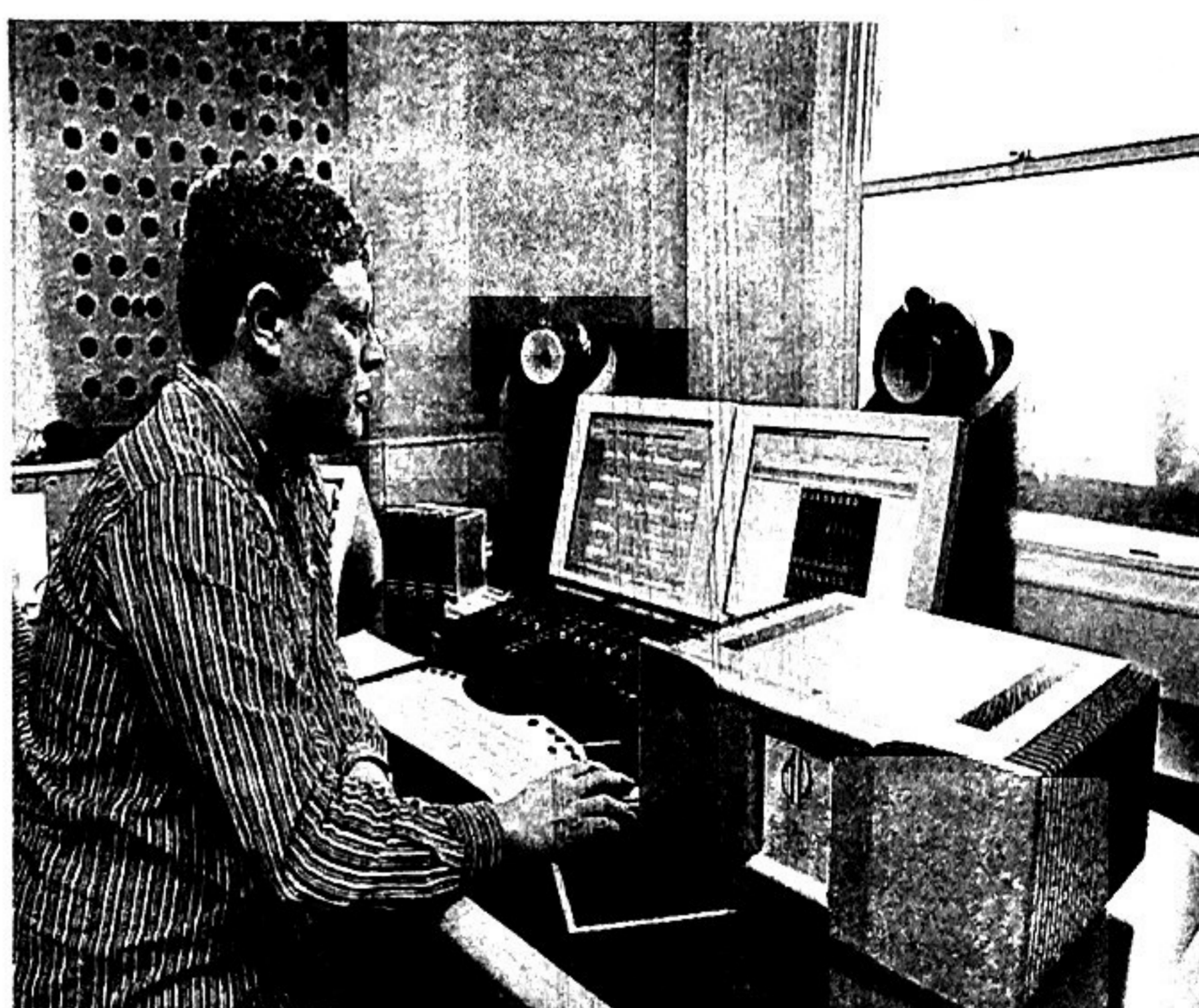
BEATLES-BEAT. Abbey Road Studios, som er eid av plategiganten Emi, kjøpte sist sommer inn fire Dynamic Precisions A1-forsterkere.

siste årene er Hegel, Embla, Doxa og Adyton.